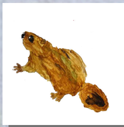
Le Castor d'Europe