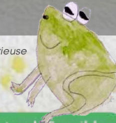
La Grenouille rieuse