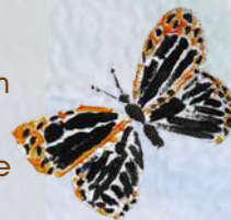
La Carte géographique

Ouvrez grands les yeux et les oreilles pour découvrir les plantes et les animaux qui vivent et font vivre ce marais. Cachées dans l'eau, les arbres, les herbes et le ciel, ce sont des centaines d'espèces qui cohabitent.