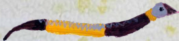
La Couleuvre à collier