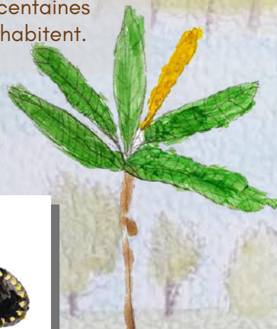
Le Saule blanc