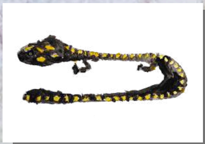
La Salamandre tachetée