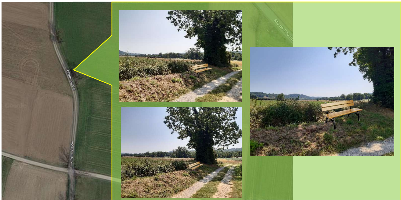
Emplacement chemin du Ver (pas chemin des rapines)

Ce site a été informé et montré en réunion via Google Maps, se rapprocher des personnes présentes en réunion pour en avoir la localisation précise (chemin des rapines) → Photos ci-dessous montrant l'emplacement précis. Le banc affiché est indicatif.